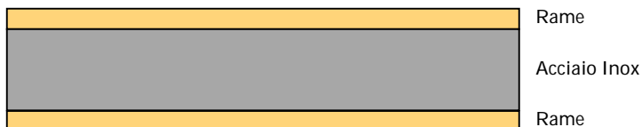
Sezione trasversale del CopperPlus

Il CopperPlus é un nastro metallico composito, ottenuto metallurgicamente mediante un processo di colaminazione. Il processo di accoppiamento é basato su una tecnologia di saldatura allo stato solido, che non richiede né adesivi, né leghe brasanti. Il rivestimento risulta perfettamente legato all'anima di acciaio inossidabile grazie alla natura del legame metallurgico che si sviluppa tra i 2 componenti.