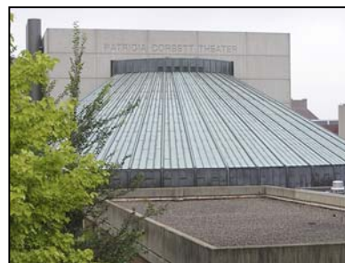
Teatro Patricia Corbett, Università di Cincinnati, tetto in CopperPlus realizzato nel 1971