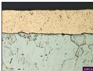
Micrografia del CopperPlus che mostra l'integrità dell'accoppiamento (500X)